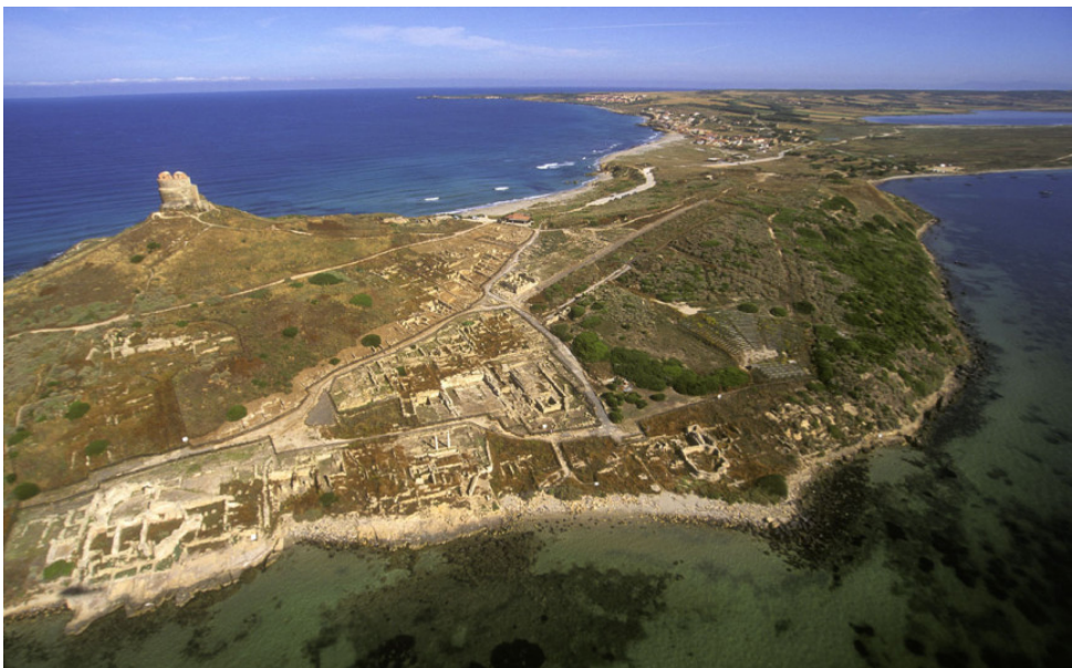
Wzgórza San Giovanni i Su Murru Mannu.

miejsowości S. Giovanni di Sinis (n. 1). Problem przyczyny tej dwuznaczności wciąż pozostaje aktualny, nie wykluczając możliwości istnienia dwóch zamieszkałych ośrodków położonych w bliskiej odległości. Pochówki, które można datować na ostatnią ćwierć VII wieku. pne, w większości przypadków są to proste doły wykopane w piasku lub wychodniach skalnych, w których osadzone są spalone szczątki zmarłego wraz z zestawami ceramicznymi i przedmiotami osobistymi. Jeśli chodzi o obszar sakralny, można wymienić najstarsze materiały znalezione w tophete (nr 6), typowym plenerowym sanktuarium fenicko-punickim, otoczonym sakralnym klauzurą i zawierającym urny ze spalonymi szczątkami zmarłych dzieci w bardzo młodym wieku i ze zwierząt składanych w ofierze oraz stele, prawdziwe kamienne tablice z symbolem lub wizerunkiem bóstwa umieszczone na tronie lub wewnątrz miniaturowej świątyni. Nadal toczy się dyskusja na temat charakteru sanktuarium tophet , czy było to miejsce składania ofiar z dzieci jako ofiary dla bóstwa, czy też, co bardziej prawdopodobne, nekropolia przeznaczona dla dzieci martwo urodzonych lub tych, którzy zmarli przedwcześnie przed przejściem rytuału przejścia i dlatego został przyjęty do społeczności dorosłych.